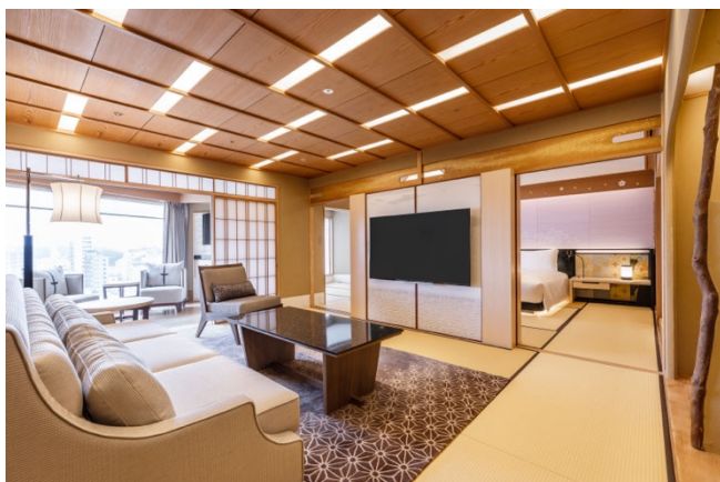
Nouvelle chambre japonaise (120 m 2 )

Tokyo, 8 juillet 2019 – À travers le temps, le décor, l'histoire et les activités proposées par Hotel Gajoen Tokyo ont forgé sa réputation de véritable porte d'entrée sur la culture japonaise . Souvent qualifié « d' hôtel musée » de par ce que l'on y voit et ce que l'on y apprend, ce lieu serein et hors du temps vient d'achever la rénovation de ses 12 chambres japonaises .