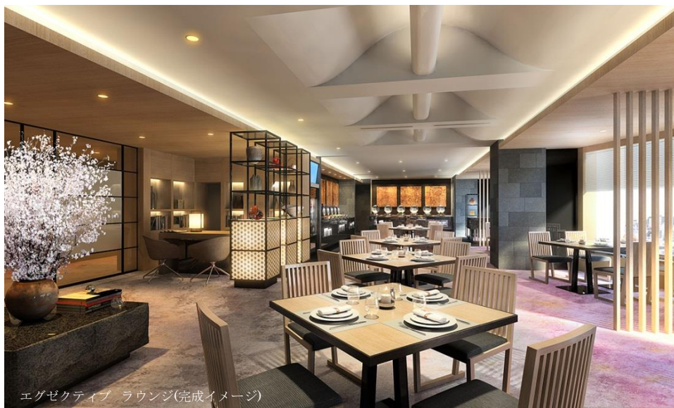
エグゼクティブ ラウンジ(完成イメージ)

目黒雅叙園(運営:株式会社目黒雅叙園/所在地:東京都目黒区)内に、新たなコンセプトに基づく客室フロアリノベーションが2016年9月より行われていました。第一弾の7階24室のリニューアルオープンを経て、今冬8階13室のリノベーションを行い、2017年3月に従来の6階客室と併せて60室の極上空間が誕生。さらに宿泊のお客様専用の上質なサービスを提供する「エグゼクティブ ラウンジ」も誕生、さらなる魅力とサービスの提供をいたします。