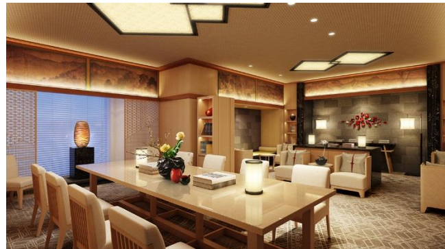
【ギャラリールーム】(定員 8名/69.93 m 2 )

紫陽花の香り立つようなみずみずしい初夏の情景を表した室内。 東側に大きく広がる窓には園内の樹木と陽光が望める。