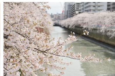
季節毎に表情も豊かな目黒川を臨む最上階