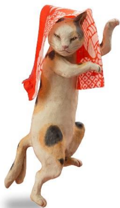
小澤康磨「猫飼好五十三疋 ばけあま」（亀山）

目黒雅叙園（運営：株式会社目黒雅叙園／所在地：東京都目黒区）では、2017年4月26日（水）から5月14日（日）まで、「福ねこ at 百段階段展 ～和室で楽しむ ねこアート～」を園内・東京都指定有形文化財「百段階段」にて開催いたします。「ねこ」は、奈良時代に日本に伝わり、平安時代には貴族の寵愛をうけてきました。さらに江戸時代には、庶民の身近な存在となり、浮世絵などのアートに登場するようになった日本人になじみの深い動物です。文化財を舞台に独創性と技量に富んだ9名のアーティストによる6ジャンルのねこアート作品（絵画、立体、陶芸、人形、彫刻、写真）、が約1,000点集合します。