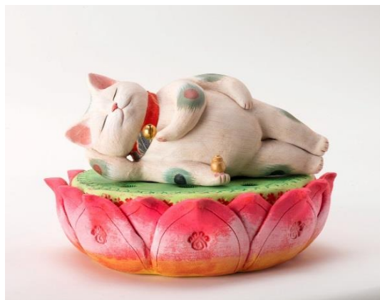
もりわじん 「葉涅槃猫」