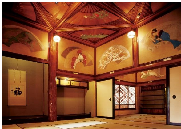
百段階段「清方の間」