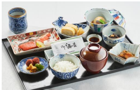
福泉窯の食器イメージ