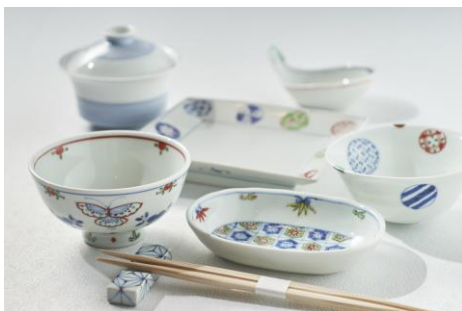
福珠窯の食器イメージ