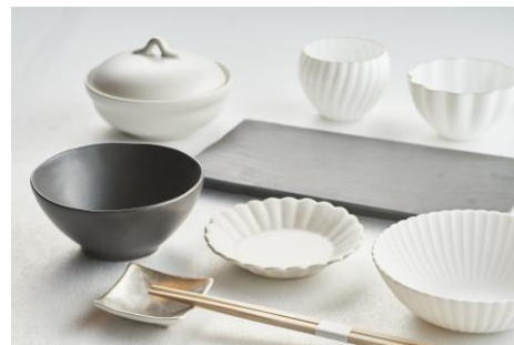
やま平窯元の食器イメージ