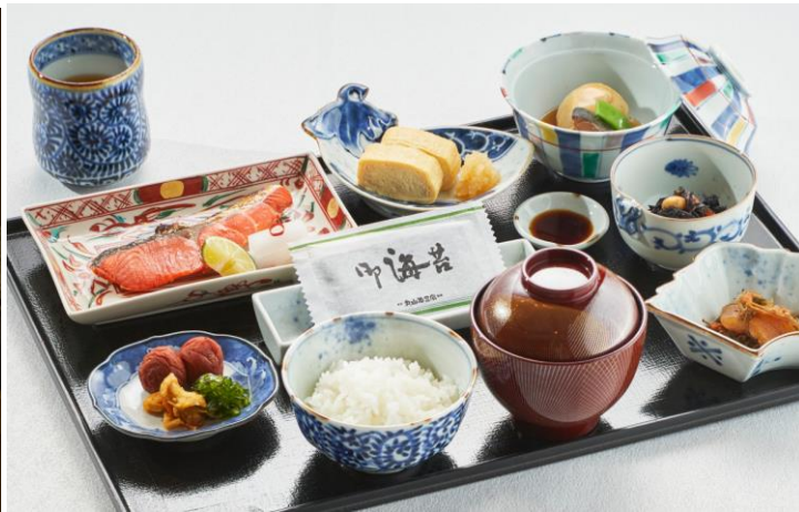
有田焼の器を使用した朝食イメージ

当ホテルは、2017年4月に86年ぶりに施設名の変更を行いました。それに伴い客室やレストランの改装も行い、ホテルとしての新たな歴史を歩み始めました。一方「有田焼」は昨年、創業400年という節目の年を迎えました。長い歴史の中で培われた伝統を継承しながら、更なる次の100年に向けて挑戦する姿勢に共感し、それぞれの“伝統と革新”を発信するため本コラボレーションが実現しました。インバウンド需要も多い昨今において、伝統的な文化を継承する両者による、新たな日本の魅力的な文化の発信を目指します。