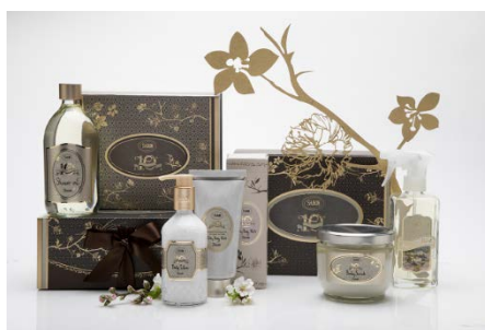
「SABON」の“Decade”10周年アニバーサリーコレクション