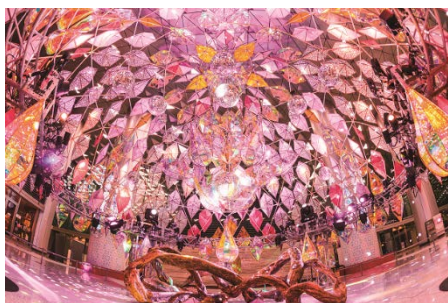
ミラーボーラーの作品(イメージ)

「百段階段」史上初となる試みとして日本上陸10周年を迎えるイスラエル発のボディケアブランド「SABON」による香りの演出が実現しました。日本からインスピレーションを受けて作られた特別なコレクション「Decade」の香りを五感で感じていただけます。