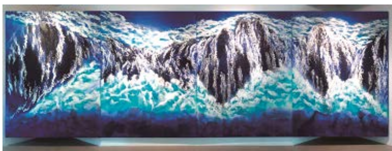
日本画家 間島秀徳氏の作品