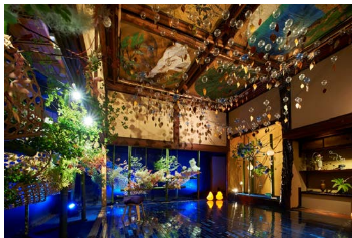
前回(2017年)の展示風景/頂上の間

会場である「百段階段」は、昭和10年に建てられ、雅叙園の歴史と共にさまざまな集いの場として多くの人々を迎えてきました。類稀な建築・美術による空間美から2009年には東京都指定有形文化財に認定されています。