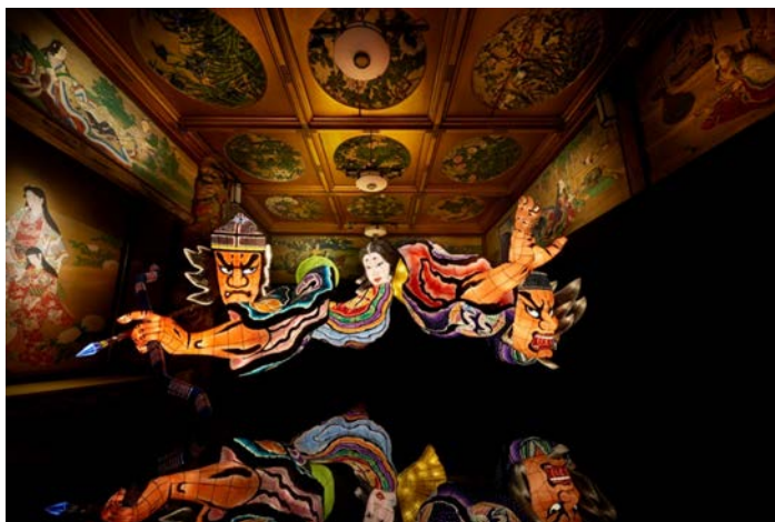
今回のために制作された青森ねぶた「竹取物語」/漁樵の間

今年、創業 90 周年を迎える日本美のミュージアムホテル、ホテル雅叙園東京(運営:株式会社 目黒雅叙園/所在地:東京都目黒区)では、2018年7月7日(土)～9月2日(日)まで「和のあかり×百段階段 2018 ～日本の色彩、日本のかたち～」を、館内にある東京都指定有形文化財「百段階段」にて開催いたします。第4回目となる今回は「青森ねぶた」をはじめ、日本各地からシリーズ最大、前回の約2倍の63団体、1,000点を超える作品が集結します。