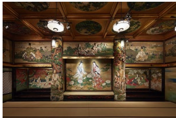
写真左から時計回り: 東京都指定有形文化財「百段階段」、十畝の間、漁樵の間

「百段階段」は、1935年(昭和10年)に建てられた当ホテルに現存する唯一の木造建築です。晴れやかな宴が行われていた7部屋を、99段の長い階段廊下が繋いでいます。2009年(平成21年)に東京都の有形文化財に指定され、創業当時の風景をいまに伝える場所でもあります。日本画の大家である かぶらききよかた 鏑木清方や、 あらかじつぼ 荒木十畝をはじめ、当時の著