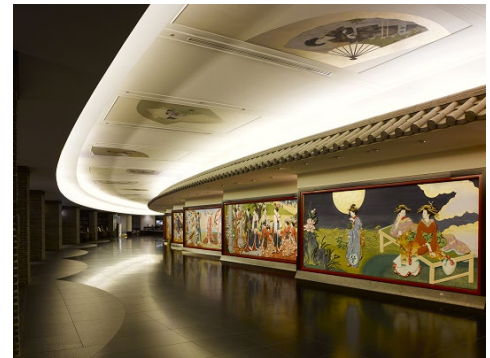
館内アートツアー(イメージ)