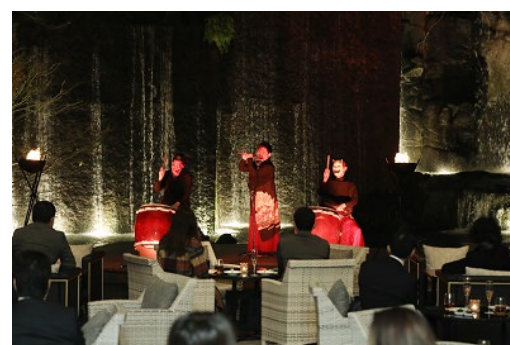
大晦日カウントダウン(イメージ)