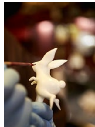
飴細工実演&ワークショップ(イメージ)

[ワークショップ] 11:30-11:50 / 13:30-13:50 / 15:30-15:50 ※各回定員6名様