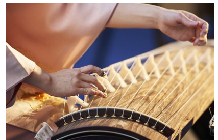
新春ランチbuffet(イメージ)