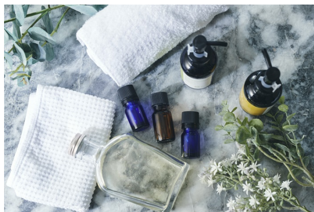
インルームスパトリートメント(イメージ)

本プランは、日本の伝統工芸品である越谷 籠染灯籠や小田原風鈴を配置し、涼を感じられるよう特別に設えられた客室で、季節に合わせてご用意する3種類のエッセンシャルオイルからお好きな香りを選んでいただき、日ごろの疲れを取り除き、身体や肌の調子を整えて心身ともにより深くリラックスした状態へと導くボディトリートメントを、インルームでお二人のためだけに行います。また、バスルームにはスチームサウナが完備されており、清涼感溢れるシトラスレモンのアロマオイルを垂らし、施術前後にご利用いただくことでより深くリラックスしていただけます。