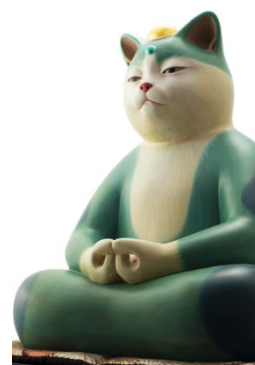
創作招き猫作家 もりわじんの作品