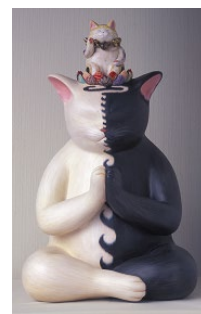
「猫の一生」(もりわじん作)