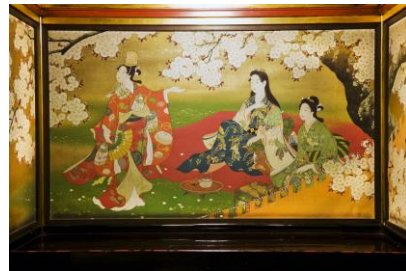
デザインのモチーフになった日本画