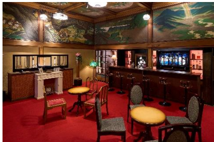
文化財 Bar (草丘の間)

当時の最先端のファッションを、銀ブラや職業婦人、夜会などのキーワードで、映画や舞台のワンシーンのような空間とともにご紹介する「モダンガールの装い」をテーマにした会場や、部屋いっぱいにステンドグラスを配し、夜のバーをイメージした会場など、モダンガールが華やかに過ごした情景に入り込み、思わず写真を撮りたくなるスポットが登場。他にも、文豪の名作と人気イラストレーターのコラボレーションシリーズ「乙女の本棚」(立東舎)より、江戸川乱歩の『人でなしの恋』をパネル展示するとともに、物語に登場するシーンを立体展示で表現し、モダンガールが生きた時代の文学世界へと引き込みます。