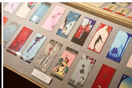
描かれたモダンガール 小林かいち (星光の間)