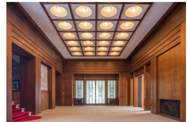
東京都庭園美術館本館大広間

東京都庭園美術館にて同時期に開催される「開館40周年記念 旧朝香宮邸を読み解く AtoZ」と連携し、相互割引を実施いたします。東京都庭園美術館のアール・デコの様式美と文化財「百段階」の世界をご一緒にお楽しみください。