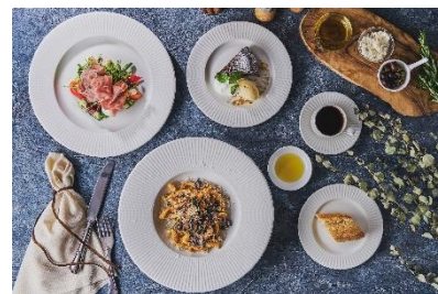
CANOVIANO CAFE お料理イメージ

【URL】 https://www.hotelgajoen-tokyo.com/archives/95074