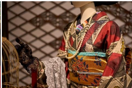
モダンガールの装い (十畝の間)