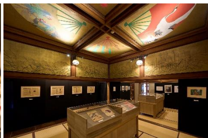
描かれたモダンガール 竹久夢二 (静水の間)