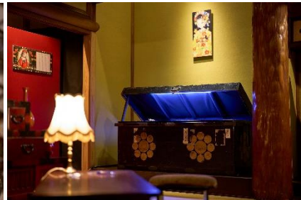
大正デカダンスと文学 (清方の間)