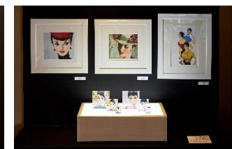
中原淳一の複製画も登場