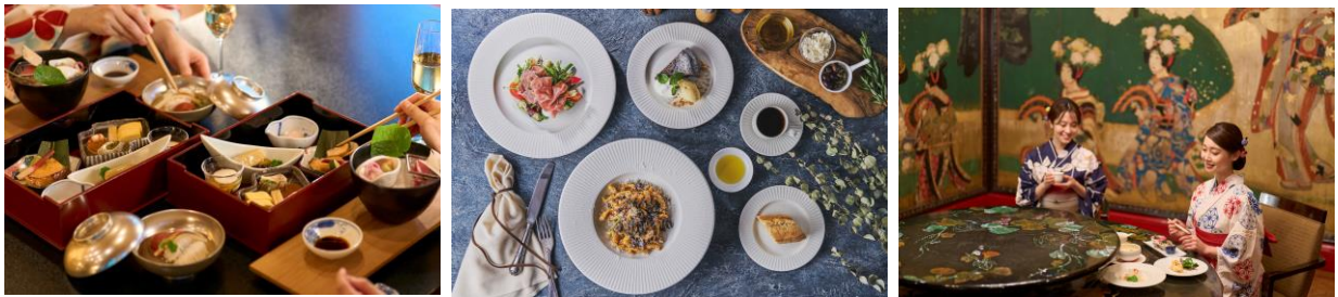
お食事イメージ：(左から) 日本料理「渡風亭」 / CANOVIANO CAFE / 中国料理「旬遊紀」

【URL】 https://www.hotelgajoen-tokyo.com/archives/52142