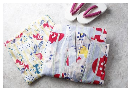
お子様浴衣(イメージ)

また、すぐ横を流れる目黒川や、目黒不動尊(ホテル雅叙園東京より徒歩約10分)、大鳥神社(ホテル雅叙園東京より徒歩約10分)など浴衣で目黒の名所散策もおおすすめです。今年の夏はホテル雅叙園東京で非日常的な時間をお過ごしください。